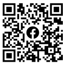
基隆市正濱國小官方 FB 網站