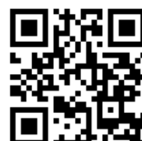
基隆市正濱國小官網