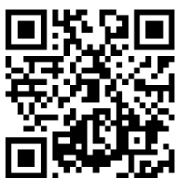
★基隆市新生線上報到網